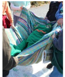
カエル人形搬送訓練の様子